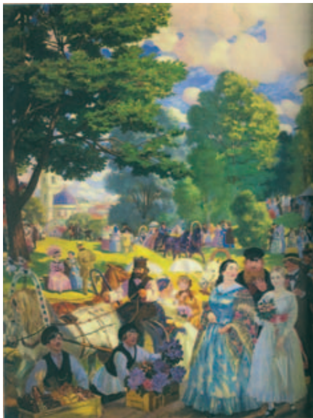
Boriss Kustodijevi maal „Pidu troitsa ajal“.

Õigeusu kirik meenutab siis Püha Vaimu laskumist apostlite peale ja austab Püha Kolmainust. Rahvakalendris käsitati seda kui taimede püha ja selle sümboliks oli kasepuu. Uskumuse kohaselt peeti kaske õnnepuuks, mis toob head ja kaitseb mustade jõudude eest. Kaseokste, aga vahel ka väikeste puukestega käidi läbi põllud, külad, tared. Majad kaunistati nii seest- kui ka väljastpoolt rohelisega. Kaski viidi ka kirikusse, põrand aga kaeti lõhnavate rohtudega. Jumalateenistuse ajal olid usklikel samuti käes kaseoksad ja lillekimbud. Kolmainu püha peeti ka neidude pühaks. Tütarlapsed panid selga pidulikud rõivad ning tegid läbi mitmesuguseid rituaale. Näiteks ehitati kasepuu, mängiti selle ümber ringmänge, kanti puud mööda küla ning seejärel lõhuti ta põllul või uputati jõkke.