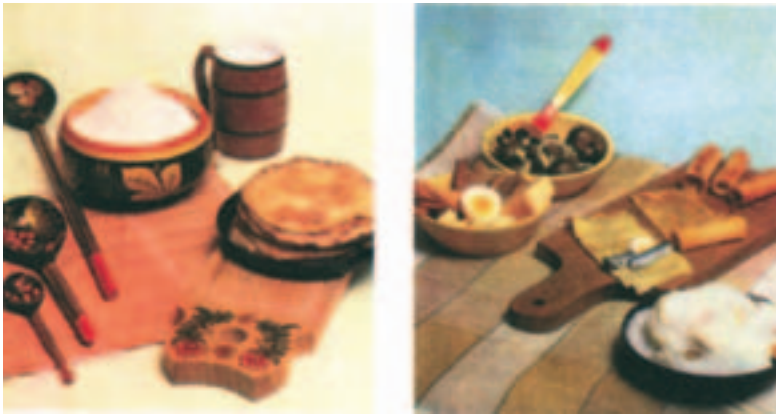
Mõned hõrgutised vene peolaualt (vastlad, pasha – viimane A. Plistoni natüürmort).

Küpsetistest on läbi aegade eriti populaarsed olnud mitmesuguse täidisega pirukad: liha-, marja-, seene-, kartuli-, kala-, köögivilja- või kohupiima-