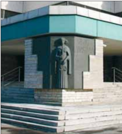
Harju maakohtu Liivalaia kohtumaja

Kohus on Eestis ainus organ, mis mõistab õigust. See tähendab, et lõplikult otsustab kõik vaidlusküsimused kohus. Kohtus on võimalik vaidlustada ka ametniku otsus. Kõigil juhtudel, kui inimese õigusi on rikutud, saab lõpliku otsuse tüliküsimuses langetada kohus.