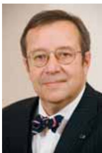
Vabariigi President Toomas Hendrik Ilves

Eesti riigi sõnum saab seetõttu olla ühene: me toetame iga siin elava mittekodaniku tahet saada Eesti kodakondsus ja liituda täielikult Eesti ühiskonnaga. See on privileeg, mis kuulub vaid Eesti Vabariigi kodanikule.