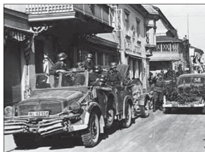
Saksa vägede sisenemine Pärnusse 1941

1941. aasta 22. juunil puhkes sõda Saksamaa ja Nõukogude Liidu vahel. Saksa armee jõudis juuli alguses Eestisse. Eestis oodati sakslaste saabumist, et pääseda bolševike terrori alt. Lisaks lootsid paljud, et sakslased toetavad Eesti iseseisvuse taastamist. Tuhanded mehed võitlesid selle nimel metsavendadena või astusid Saksa sõjaväkke. Sakslased Eesti riigi iseseisvust ei taastanud. Algasid natslikud repressioonid. Eestis hukati 8000 inimest, nende hulgas umbes tuhat Eesti juuti ja tuhat Eesti venelast. Mitu tuhat inimest saadeti