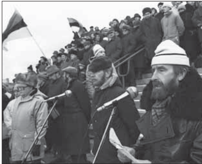
Rahvarinde poolt korraldatud miiting Linnahalli juures 1988

1985. aastal sai Nõukogude Liidu Kommunistliku Partei keskkomitee peasekretäriks Mihhail Gorbatšov, kelle eestvõttel algas perestroika ja glasnost . Üks esimesi sellest ajendatud üritusi Eestis oli „fosforiidisõda”. Nõukogude Liidu väetisetööstuse ministeerium kavandas Lääne-Virumaale suurt fosforiidikaevandust.