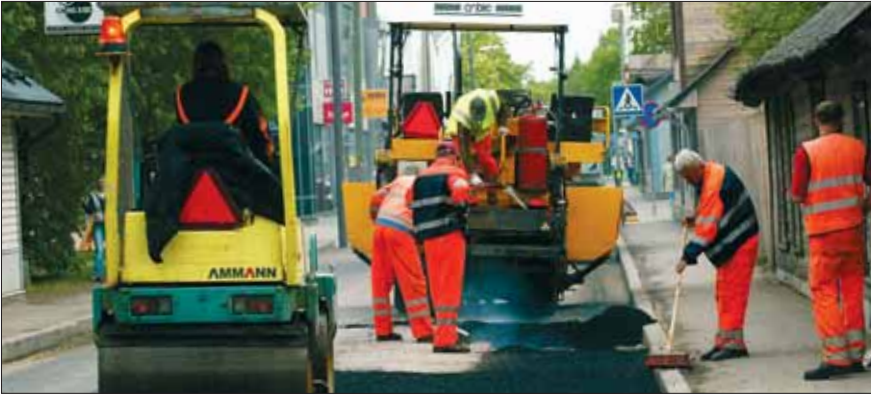
Teede korrashoid on kohaliku omavalitsuse ülesanne

Kohalikul omavalitsusel on oma ülesannete täitmiseks iseseisev eelarve . Eelarveraha saadakse üksikisiku tulumaksust ja maamaksust, samuti riigi-eelarvest. Valla- või linnavolikogu võib kehtestada ka kohalikke makse .