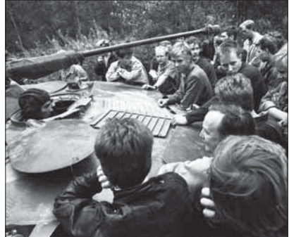
1991. aasta riigipöördekatse ajal Eestisse saadetud Nõukogude armee tank Tallinna lähistel Kloostrimetsas

Riigipöördekatse Moskvas 1991. aasta augustis tõi kaasa iseseisvuse lõpliku taastamise . Pihkvast Tallinna saadetud õhudesant-diviisi üksuste kohalolekule vaatamata otsustasid Eesti ülemnõukogu ja Eesti Kongress 20. augustil 1991 taastada Eesti iseseisvuse. Seda otsust tunnustasid kiiresti lääne-riigid ja Venemaa.