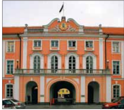
Riigikogu kogunemispaiik – Toompea loss

Seadusi saab vastu võtta ka rahvahääletusel. Rahvahääletuse korraldamise saab otsustada üksnes Riigikogu. Rahvahääletuse otsus on Riigikogule, valitsusele ning teistele riigijorganitele kohustuslik. Otsus on vastu võetud, kui selle poolt on rohkem kui pooled hääletanud inimestest.