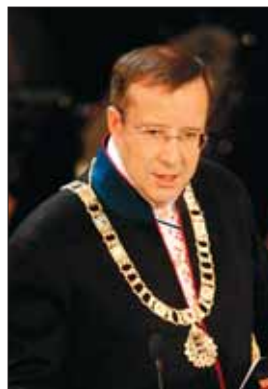
Toomas Hendrik Ilves

Pärast Eesti iseseisvuse taastamist on Eesti presidendid olnud aastail 1992–2001 Lennart Meri ja aastail 2001–2006 Arnold Rüütel. Alates 2006. aastast on Eesti president Toomas Hendrik Ilves.