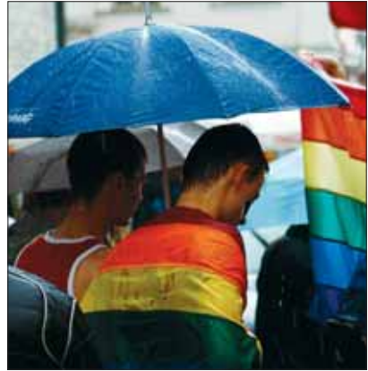
Eestis on igaühel õigus tutvustada oma vaateid

tutvustada sõnas, pildis või muul viisil. Mõtted võib kirja panna raamatusse või kirjutada artikli, kommenteerida võib ka teiste väljaütlemisi internetis. Seda tehes tuleb silmas pidada teiste inimeste õigusi ja vabadusi ning hoida avalikku korda. Riigil on kohustus tagada igaühe õiguste ja vabaduste kaitse, tõrjuda rassilist või poliitilist vihkamist.