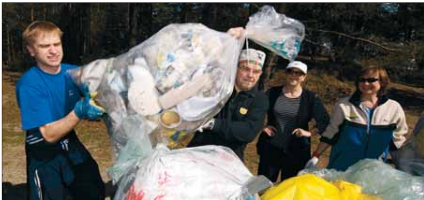
Koristuspäev „Teeme ära 2008”

Osalusveebis www.osale.ee on igal inimesel võimalik esitada valitsusele ettepanekuid, koguda allkirju kodanikualgatuse toetuseks, avaldada arvamust valitsuse eelnõude kohta.