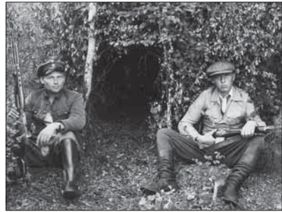
Metsavennad oma punkri ees

Maa oli kogu rahva omandiks kuulutatud juba 1940. aastal, kuid talumajapidamised jäid Eestis siis alles. Jõukamatele talupidajatele kehtestati kõrged riiginormid ja maksud. Alles 1949. aasta küüditamine hirmutas suurema osa talupidajatest kolhoosidesse , mis tõi kaasa põllumajanduse allakäigu. Maaelu hakkas jälle edenema kümnekonna aasta pärast. Teise maailmasõja järel jätkus Eestis relvastatud vastupanuliikumine – metsavendlus . See suudeti maha suruda alles 1940. aastate lõpuks, kui oli küüditatud suur osa metsavendade toetajatest. Arreteeritud ja küüditatud inimesed hakkasid Eestisse tagasi pöörduma pärast Stalini surma 1953. aastal. Tagasitulijaid oli umbes 30 000.