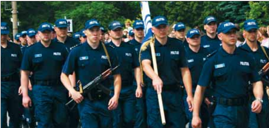
Õigus töötada politseinikuna on ainult Eesti kodanikul

Eesti riik kaitseb oma kodanike õigusi välisriikides . Eesti saatkond aitab Eestisse tagasi pöörduda kodanikul, kes on välismaal reisisid või elades hätta sattunud. Vajaduse korral aitab saatkond vormistada uue reisidokumendi, hankida kojusõidu piletit, korraldada arstiabi jne.