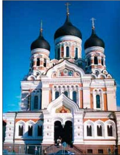
Suurvürst Aleksandri peakirik Toompeal

Eestis on registreeritud üle viiesaja usulise ühenduse. Suurim on 180 000 liikmega Eesti Evangeelne Luterlik Kirik. Moskva Patriarhaadi Eesti Õigeusu Kirikul on 170 000 liiget ning Eesti Apostlik-Õigeusu Kirikul 25 000 liiget.