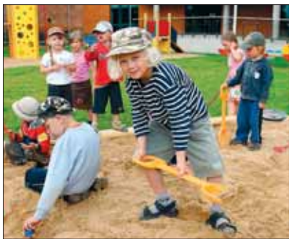
Kohalikud omavalitsused peavad üleval lasteaedu

Valla ja linna ülesanne on näiteks korraldada eakate inimeste hoolekan- net, veevarustust, prügimajandust, teede ja tänavate korrashoidu jne. Samuti peab kohalik omavalitsus üleval lasteaeda, kooli, raamatukogu ja rahvamaja.