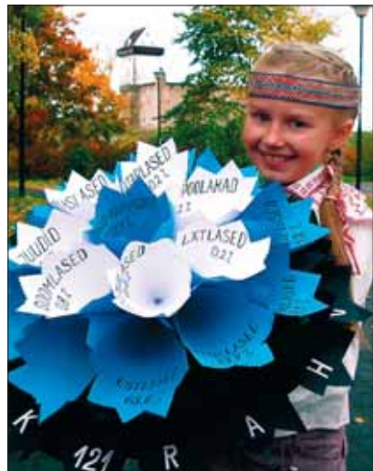
Töö fotokonkursilt „Üks riik – 121 rahvust“

Eesti kuulub rahvaarvu poolest maailma väiksemate riikide hulka.