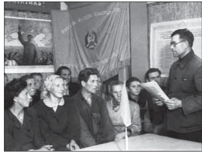
Kolhoosiesimees koosolekul kõnelemas

sõjaväes, kui ka suur hulk „Nõukogude-vastast elementi”. Jätkusid ka küüditamised : 1945. aastal viidi Siberisse mõnisada Eestisse jäänud sakslast, 1949. aastal küüditati üle 20 000 inimese, peamiselt talupojad, 1951. aasta alguses Jehoova tunnistajad.