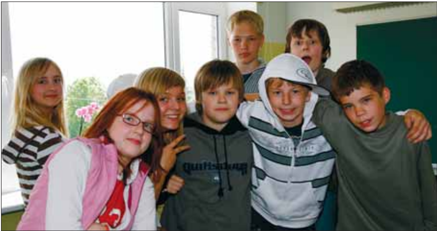
Kõigil on õigus ja kohustus haridusele

omavalitsusi võivad ajaloolisest traditsioonist lähtudes moodustada saksa, vene, rootsi ja juudi vähemusrahvusest isikud. Lisaks nendest vähemusrahvustest isikud, kelle arv Eestis on üle 3000. Tänapäevaks on oma kultuuriautonomia õiguse teostanud soomlased ja rootslased. Riigilt on toetust saanud ka Peipsi ääres elavad vanausulised. Eestis töötab 18 eri rahvaste pühapäevakooli ning rohkem kui 200 kultuuriseltsi. Vähemusrahvuse kultuuriomavalitsuse põhieesmärgid on korraldada emakeele õpet ja kultuuriüritusi, moodustada rahvuslikke kultuuriasutusi jne.