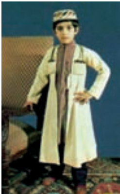
Šäki poisi rahvarõivad