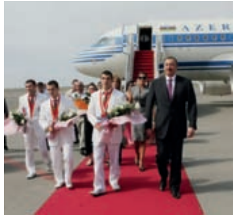
President Ilham Äliyev võtab vastu Pekingi Olümpiamängudelt saabunud medalivõitjaid

Suur tähelepanu spordile ja võimaluste loomine selle harrastamiseks on kaasa toonud võistkondlike spordialade edu. Häid tulemusi on saavutanud näiteks Aserbaidžaanri võrkpallurid: naiskondlikus arvestuses on võidetud Euroopa karikas.