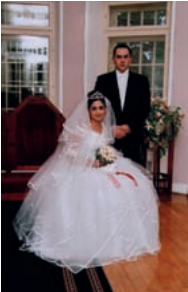
Pruudi vööle on seotud punane lint

Pruudi usaldusalune, peiupoiss ja sõbranna ehivad tütarlast. Peigmehe usaldusalune annab üle raha pruudi näo kaunistamiseks. Tütarlapse vanemad lähevad tütre juurde ja ütlevad talle kaasa oma head soovid.