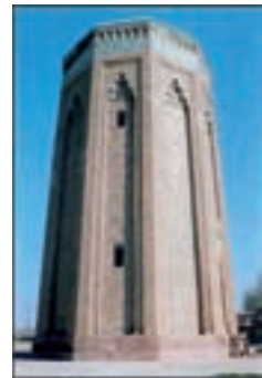
Möminä Khatuni mausoleum Nakhtšövanis

Arhitektuurimälestiste hulka kuuluvad mitmed memoriaalehitised: Džugi mausoleum (XIII sajand), Garabaglar (XIV sajand) Nakhtšövanis, Bärdä,