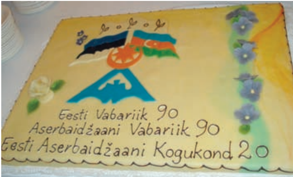
28. mail 2008 tähistas Eesti Aserbaidžaanis kogukond kolme olulist tähtpäeva: Eesti Vabariigi 90. sünnipäeva, Aserbaidžaanis Vabariigi 90. sünnipäeva ja oma kogukonna 20. sünnipäeva

Tegutseb ka Eesti-Aserbaidžaanis suhete uurimise instituut, mille eesotsas on Džäfär Mämmädoov. Temalt on ilmunud raamat “Eestlased Aserbaidžaanis”.