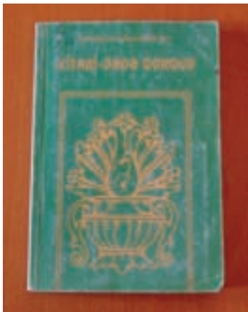
“Kitābi Dādā Gorgud”...