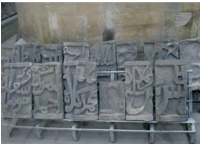
lidsetest aegadest pärinevad kivist raamatud

On teada, et ammustel aegadel Aserbaidžaani külastanud rännumehi häämmastas sealsete looma- ja inimkujudega ning erinevate süžee-kompositsioonidega reljeefide rohkus. Neid võis näha nii majade seintele tahutuna kui ka hauaplaatidele raiutuna. Širvani ja Mugani steppides ning Karabahhi tasandikel on säilinud suursuguseid raidkujusid: mõned neist on umbes kolme meetri kõrgused. Lisaks rituaalsele tähendusele sümboliseerisid need ennevanasti ka rahva võitmatust ja võimsust. Keskaegsetest kivilõigetest on tuntumad Kaspia mere põhjast avastatud nn Bailovi kivid – XIII sajandist pärinevad reljeefsed kiviplaadid.