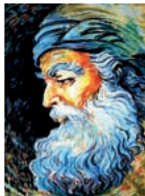
Dädä Gorgud on aserbaidžaanide armastatumaid tegelasi

IX sajandi lõpul suurenes pärsia keele osatähtsus. Pärsiakeelse luule kõrgajaks kujunes XII sajand, kus hinnatuim oli Khagani, Širvani ja Nizami looming.