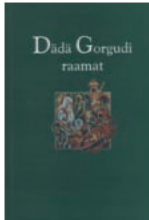
... ja “Dādā Gorgudi raamat”