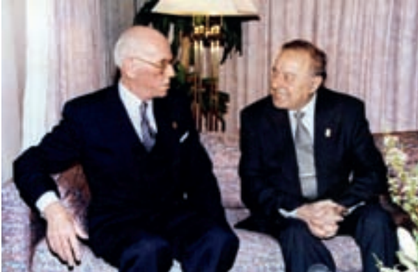
Eesti Vabariigi president Lennart Meri ja Aserbaidžaaani Vabariigi president Heydär Äliyev kohtumisel 1990. aastate lõpus

1936. aastal saadeti see ühendus laiali ja Aserbaidžaanist sai NSV Liidu liiduvabariik. Riigi territooriumil elavat turgi rahvast hakati nimetama aserbaidžaanideks ja nende kõneldavat keelt aserbaidžaaani keeleks.