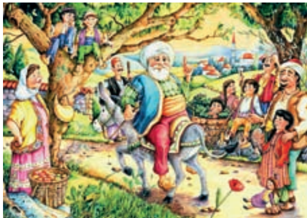
Mulla Näsräddiniga seotud lustakas-õpetlikke lugusid kantakse edasi põlvest põlve