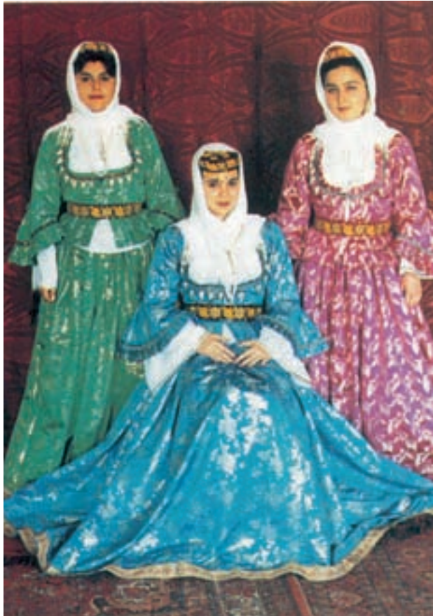
Gändžä naise rahvarõivad

XVI–XVII sajandil arenesid rahvuslikud kostüümid oluliselt. Riietuse põhjal võis kindlaks teha inimese vanuse, ameti, sotsiaalse kuuluvuse.