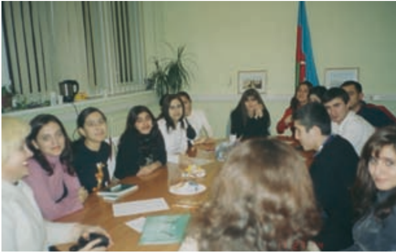
Pühapäevakooli õpilased tunnis