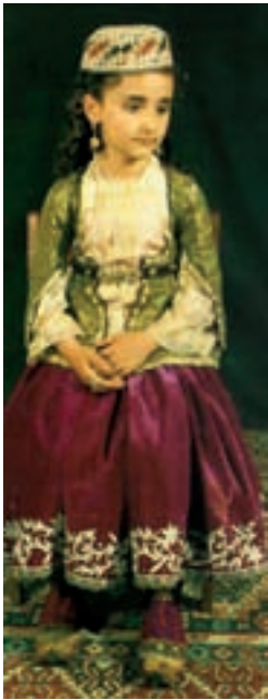
Šamakhõ tütarlapse rahvarõivad