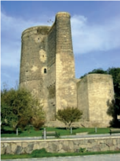
Bakuu sümbol Neitsitorn (Göz Galasö)

Erilist huvi pakub tornidest koosnev kaitserajatiste kompleks Abšeronis (Märdäkanides, Närdäranis, Bilgähis, Ramani, Mäštagi jt). Bakuu sümbol on monumentaalne kaheksajärguline XII sajandist pärinev Neitsitorn (Göz Galasö). Selle kõrgus on 28 meetrit ja vundamendi-seinte paksus 5 meetrit.