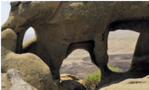
Mitmekesisel looduses võib end ikka ja jälle leida mägede keskelt

Aserbaidžaani loomariik on samuti mitmekesine: seal võib leida 15 000 selgrootu-, 97 kala-, 67 kahepaikse ja roomaja- (neist ohustatud on 13), 357 linnu- (ohustatud 36) ja 97 imetajaliiki (ohustatud 14, sh kaspia hüljes,