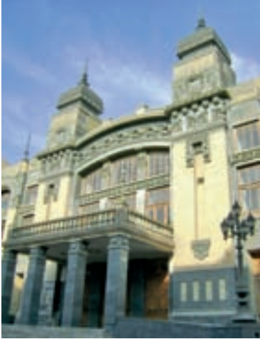
Aserbaidžaaani Ooperi- ja Balletiteater

Oma olemuselt on teater olnud alati realistlik ja seotud lihtrahva eluga. Rahvusliku teatri repertuaar koosnes kindla eetilise sisuga väikestest näidenditest (farssidest).