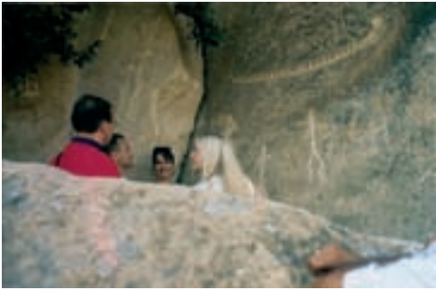
Eestis elavad aserbaidžaanid uudistamas Gobustani kaljujooniseid

Aserbaidžaanid teatakse kui unikaalsete vaipade maad. Sajandite kestel on sealsete meistrite kunst saavutanud täiuslikkuse. Arheoloogilised mälestised kõnelevad, et riigi territooriumil kooti kangast juba IX sajandil eKr.