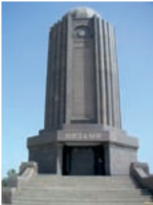
Nizami Gändžävi monument Gändžäs

Aserbaidžaan pealinn Bakuu on imeilus linn, mis ühendab endas nii idamaiseid kui ka läänelikke jooni. Koht, mida Bakuus peab kindlasti nägema, on Neitsitorn (Göz Galasõ). Seda peetakse linna südameks. Huvitav on tutvuda ka karavanseraiga: ammustel aegadel kasutasid seda peatuspaigana linna küllastanud inimesed. Nüüdisarhitektuuri näiteks on Bakuu Rahvuspanka hoone.